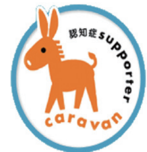
認知症サポーターキャラバン