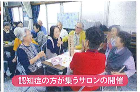
認知症の方が集うサロンの開催