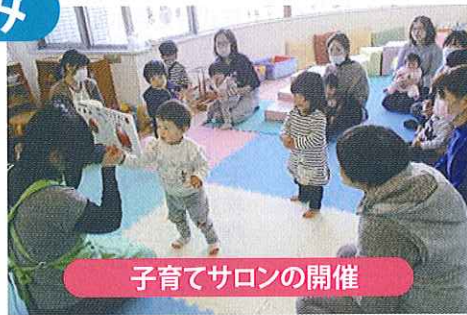
子育てサロンの開催

「地域の福祉力(=自覚・責任・協同)で実現する信頼の絆で結ばれた共生社会」を基本理念に、「ふれあい・見守り・支え合い活動」の充実発展に努めていきます。