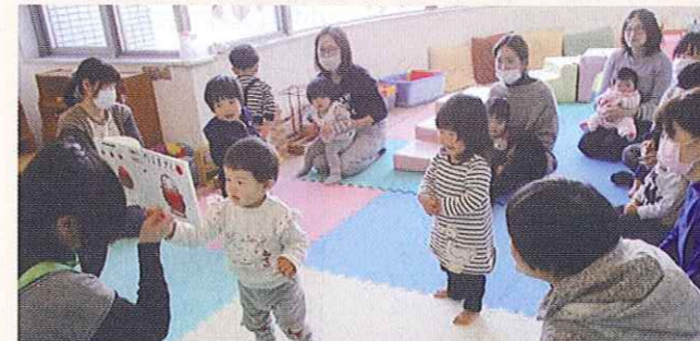
子育てサロンの開催