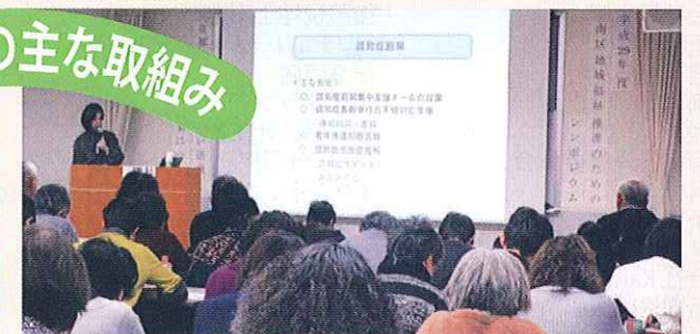
こころの健康を考える会発表会・講演会