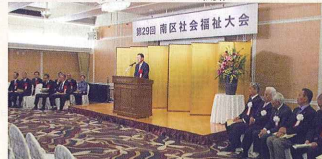
南区社会福祉大会