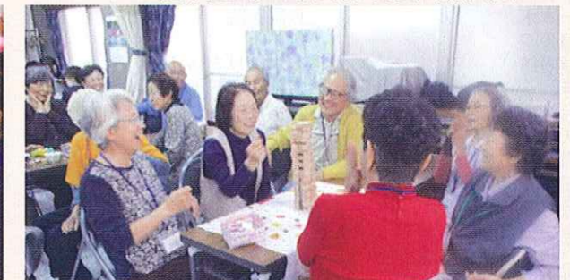
認知症の方が集うサロンの開催