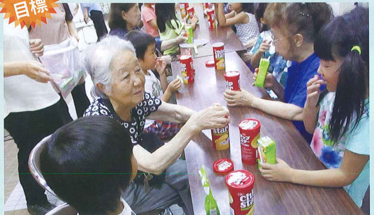
喫茶 談話室 (健康すこやか学級)