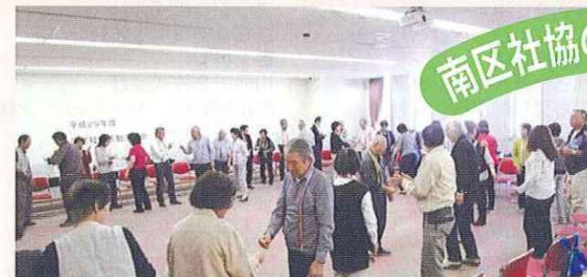
学区社協活動交流会

南区社会福祉協議会では、「地域の福祉力(=自覚、責任、協同)で実現する信頼の絆で結ばれた共生社会」を基本理念に、「ふれあい・見守り・支え合い活動」の充実発展に努めています。