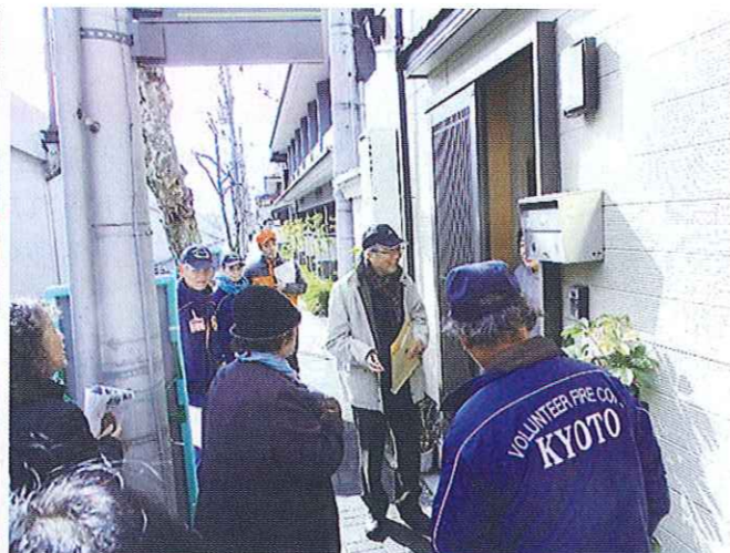
独居・要配慮者宅訪問活動