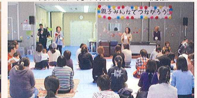
親子みんなであつなろう