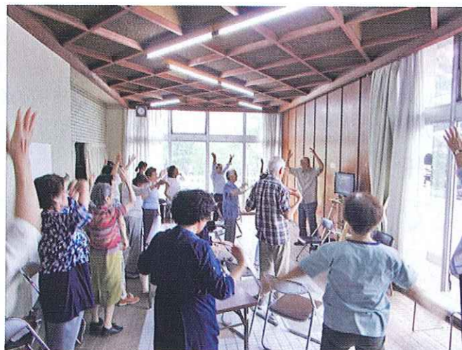
喫茶 談話室 (健康すこやか学級)