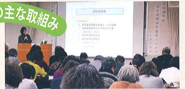
こころの健康を考える会発表会・講演会