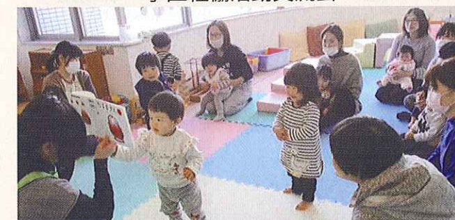
子育てサロンの開催