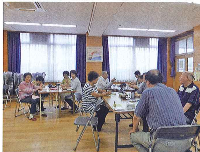
健康すこやか学級 (冷茶会)