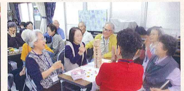
認知症の方が集うサロンの開催