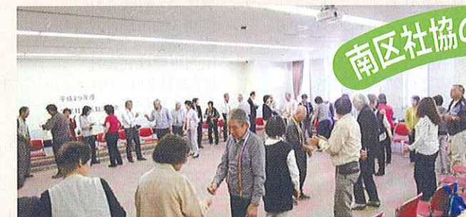
学区社協活動交流会