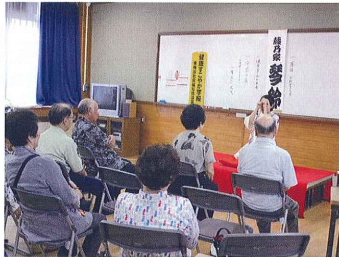
健康すこやか学級 (落語会)