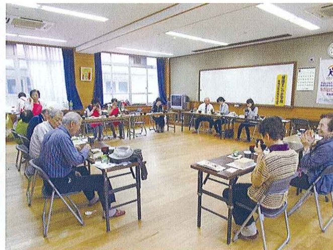
健康すこやか学級 (会食会)