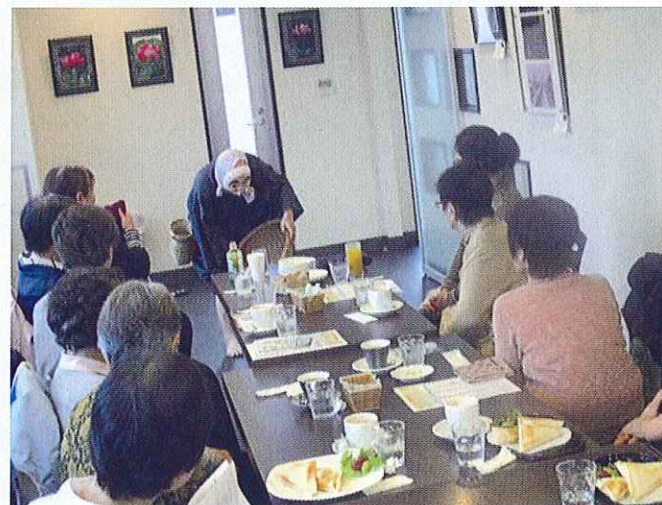
健康すこやか学級 (喫茶)