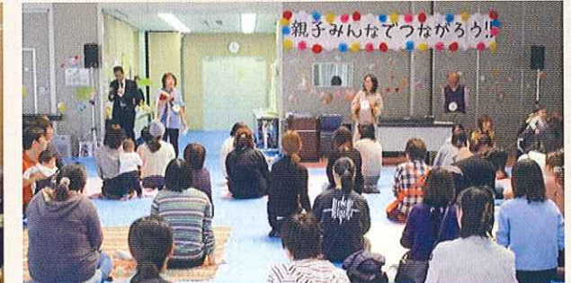
親子みんなでつながろう