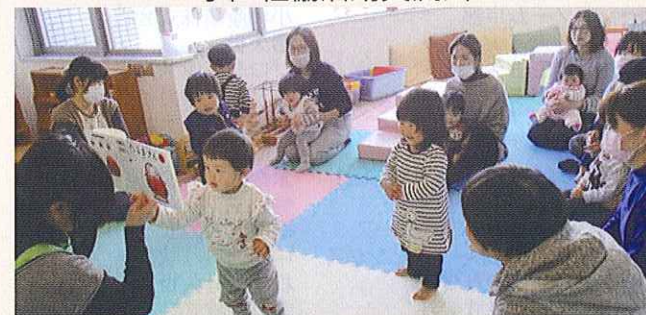
子育てサロンの開催