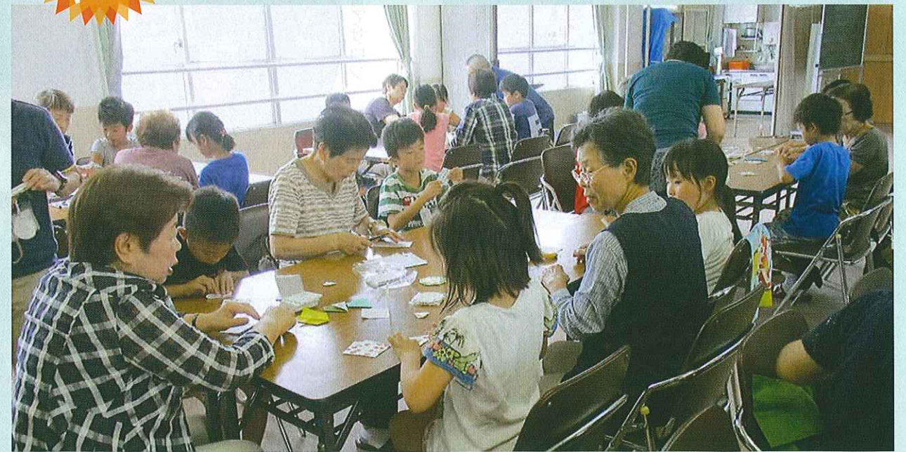
九条ふれあいサロン