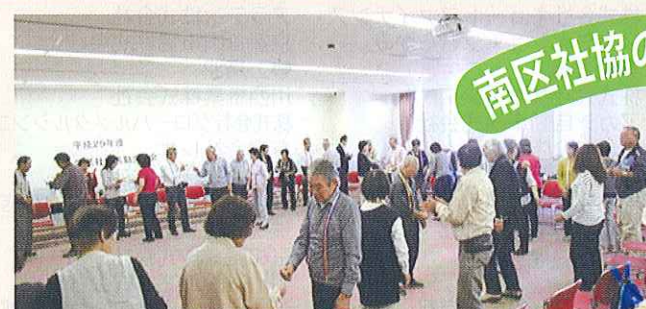
学区社協活動交流会

南区社会福祉協議会では、「地域の福祉力(=自覚、責任、協同)で実現する信頼の絆で結ばれた共生社会」を基本理念に、「ふれあい・見守り・支え合い活動」の充実発展に努めています。