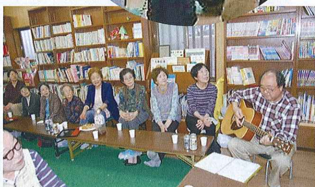
健康すこやか学級