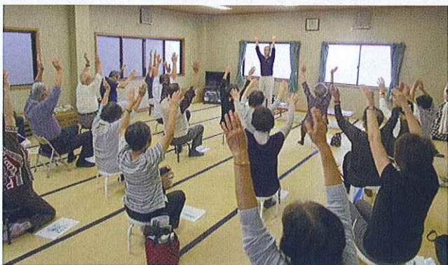
健康すこやか学級