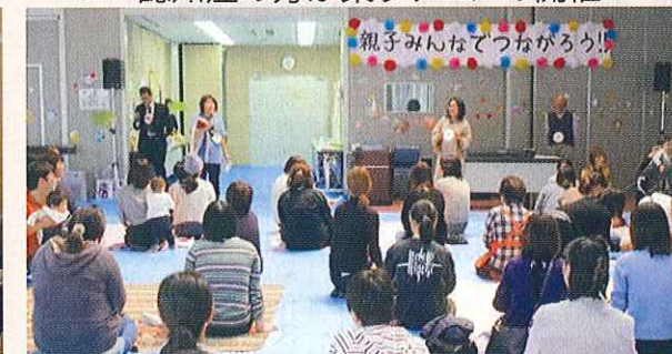
親子みんなであつなごろう