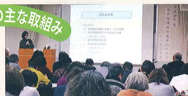
こころの健康を考える会発表会・講演会