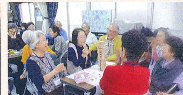
認知症の方が集うサロンの開催