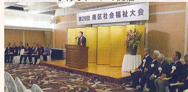
南区社会福祉大会