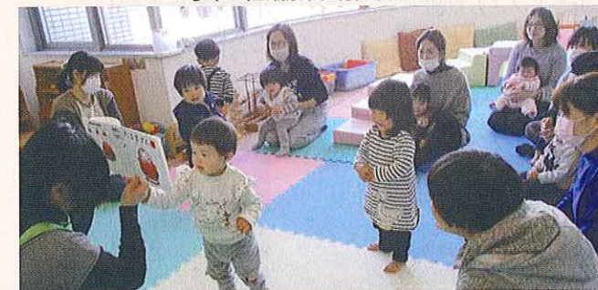
子育てサロンの開催