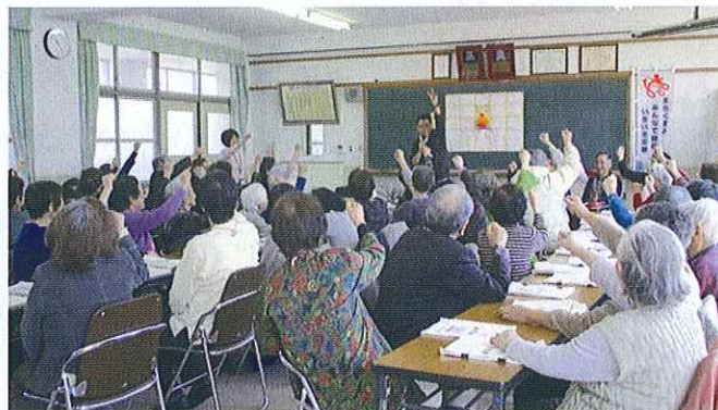
健康すこやか学級