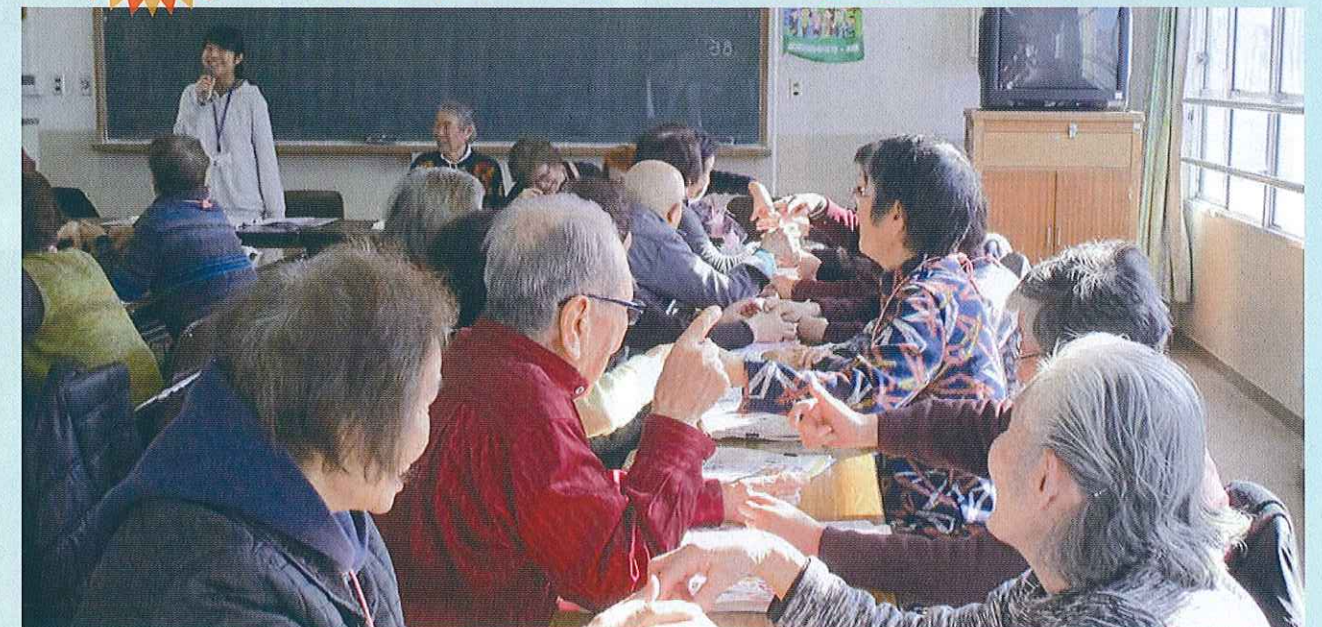
健康すこやか学級