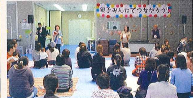
親子みんなであそぼう