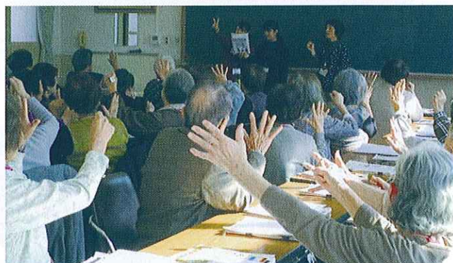
健康すこやか学級