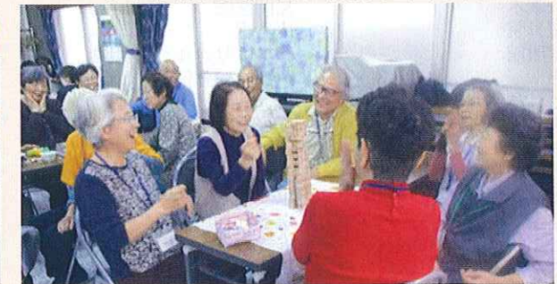
認知症の方が集うサロンの開催