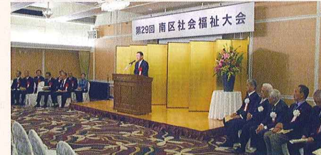
南区社会福祉大会