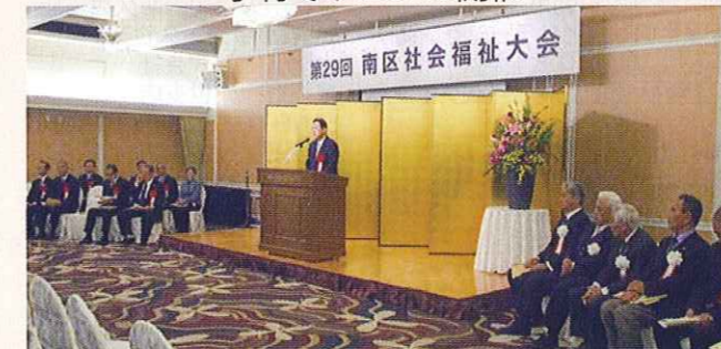
南区社会福祉大会