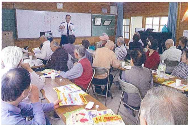
塔南シニアの集い (健康すこやか学級)