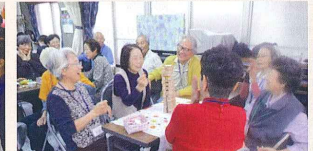
認知症の方が集うサロンの開催