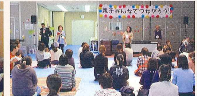
親子みんなであつなろう