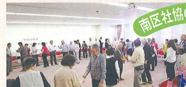
学区社協活動交流会

南区社会福祉協議会では、「地域の福祉力(=自覚、責任、協同)で実現する信頼の絆で結ばれた共生社会」を基本理念に、「ふれあい・見守り・支え合い活動」の充実発展に努めています。