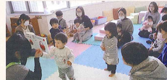
子育てサロンの開催