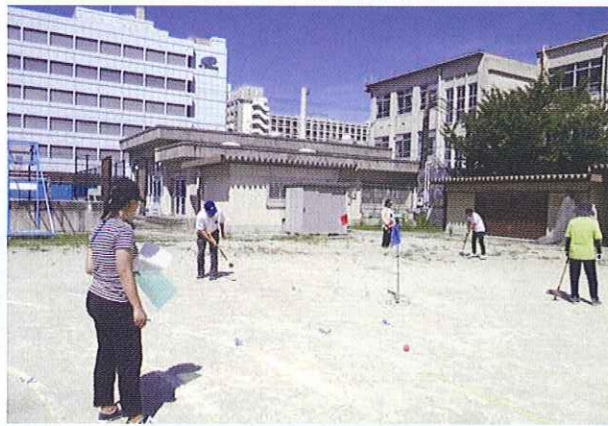
塔南シニアの集い (健康すこやか学級)