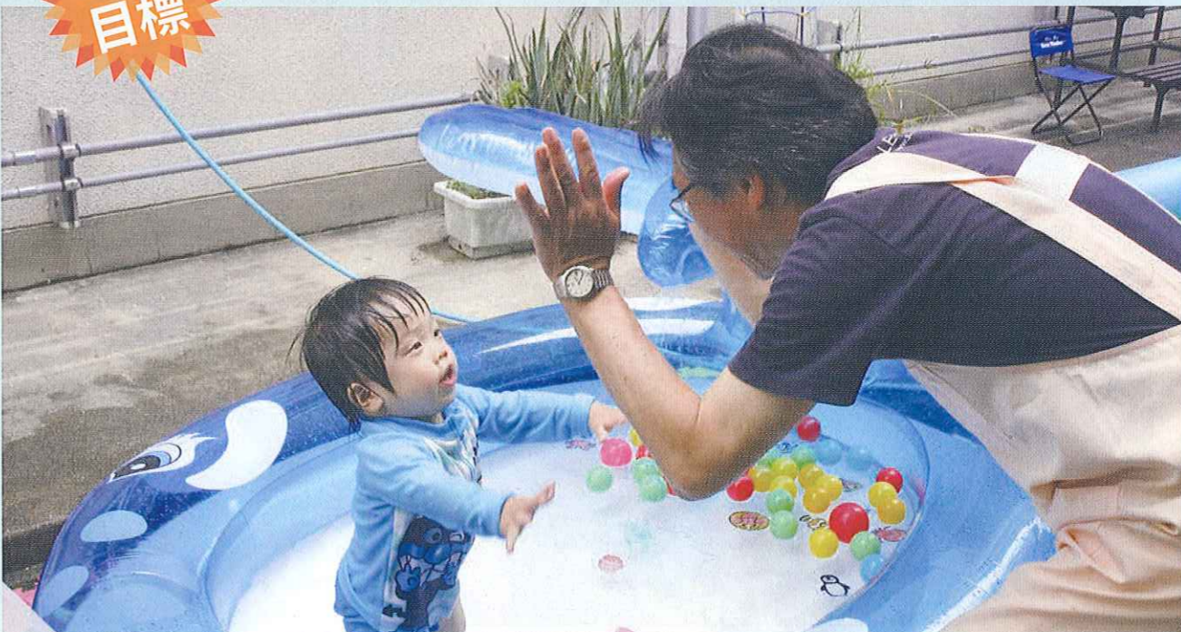
子育てサロンなないろCute