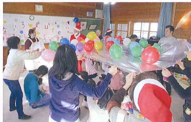
子育てサロンなないろ Cute