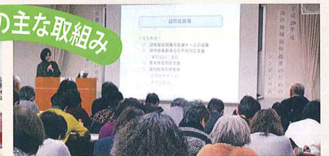
こころの健康を考える会発表会・講演会