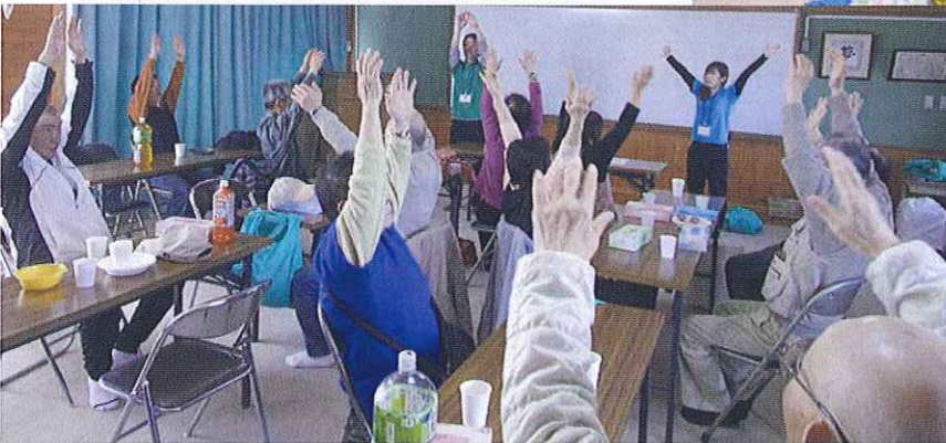
塔南シニアの集い (健康すこやか学級)