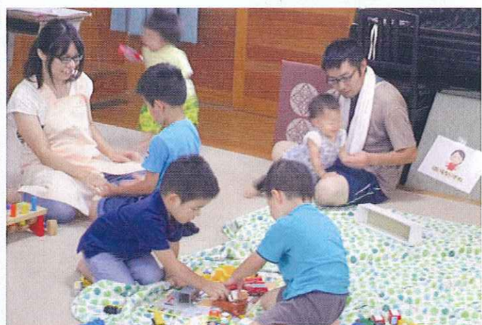
子育てサロンなないろ Cute