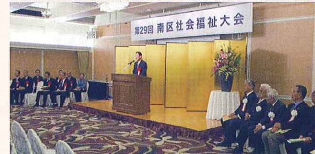
南区社会福祉大会