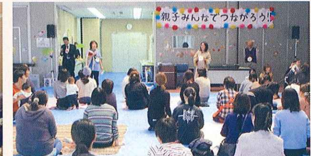
親子みんなであそぼう