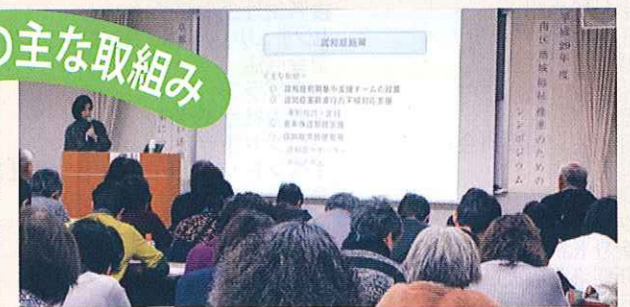
こころの健康を考える会発表会・講演会