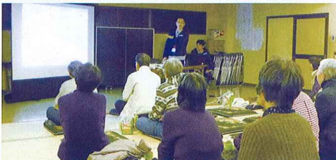
福祉協力員研修会