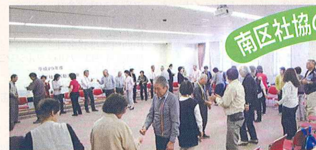
学区社協活動交流会

南区社会福祉協議会では、「地域の福祉力(=自覚、責任、協同)で実現する信頼の絆で結ばれた共生社会」を基本理念に、「ふれあい・見守り・支え合い活動」の充実発展に努めていきます。