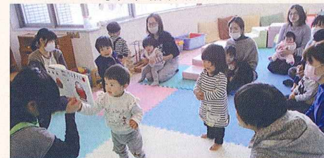
子育てサロンの開催