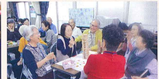
認知症の方が集うサロンの開催