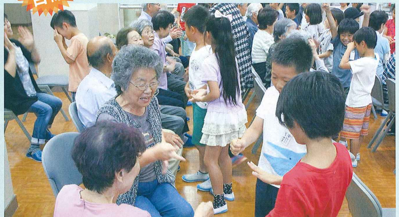
お年寄り子どもたちとのふれあい給食会