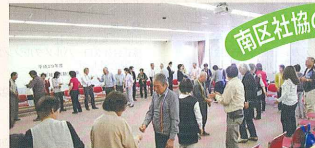
学区社協活動交流会

南区社会福祉協議会では、「地域の福祉力(=自覚、責任、協同)で実現する信頼の絆で結ばれた共生社会」を基本理念に、「ふれあい・見守り・支え合い活動」の充実発展に努めていきます。