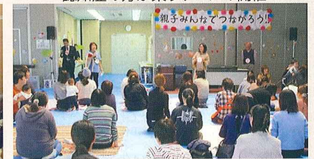
親子みんなであつなろう