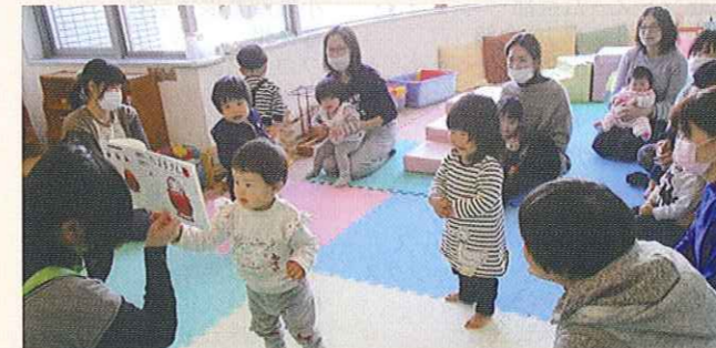
子育てサロンの開催