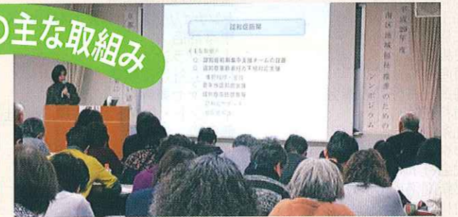
こころの健康を考える会発表会・講演会