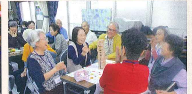
認知症の方が集うサロンの開催