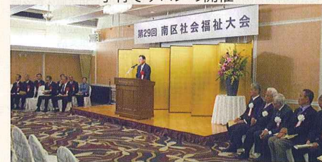
南区社会福祉大会