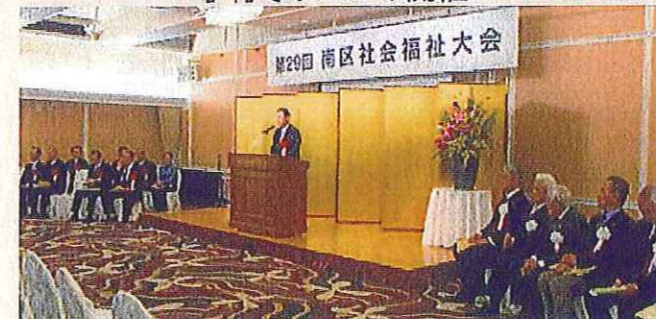
南区社会福祉大会