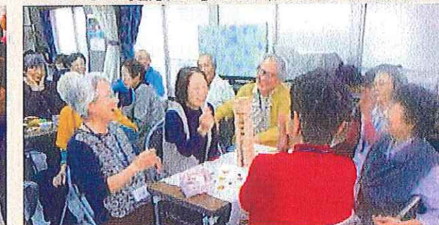
認知症の方が集うサロンの開催