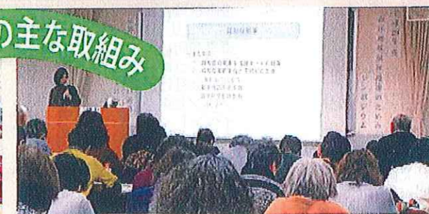
こころの健康を考える会発表会・講演会