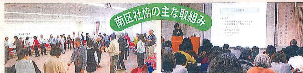
学区社協活動交流会

南区社会福祉協議会では、「地域の福祉力(=自覚、責任、協同)で実現する信頼の絆で結ばれた共生社会」を基本理念に、「ふれあい・見守り・支え合い活動」の充実発展に努めています。