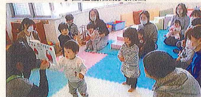
子育てサロンの開催