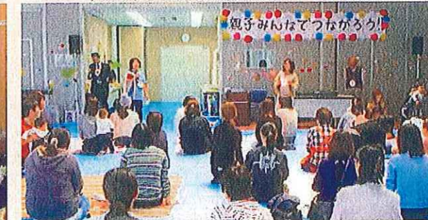
親子みんなであつなろう