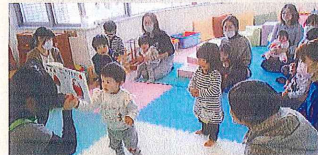
子育てサロンの開催