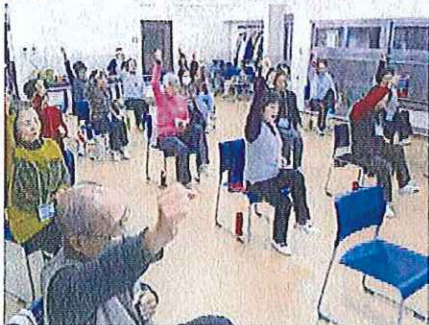
健康すこやか学級