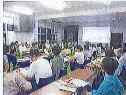
福祉協力員研修会