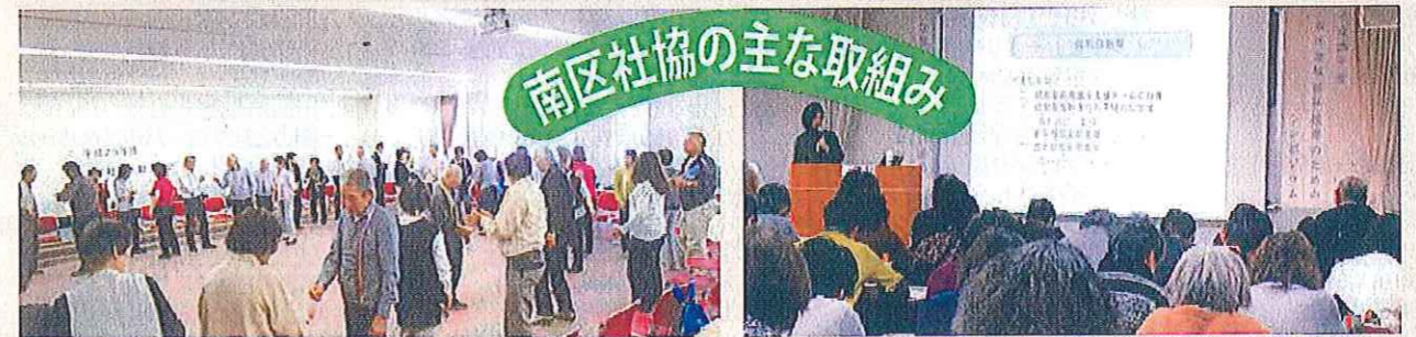
学区社協活動交流会

南区社会福祉協議会では、「地域の福祉力(=自覚、責任、協同)で実現する信頼の絆で結ばれた共生社会」を基本理念に、「ふれあい・見守り・支え合い活動」の充実発展に努めていきます。