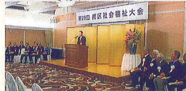
南区社会福祉大会