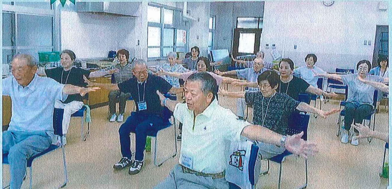
健康すこやか学級