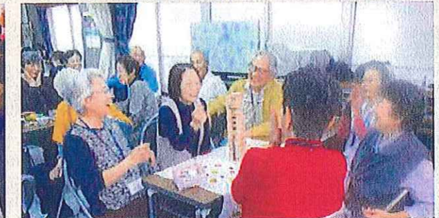
認知症の方が集うサロンの開催