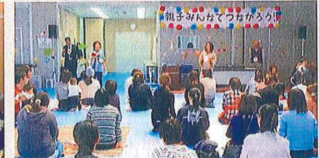
親子みんなであそぼう