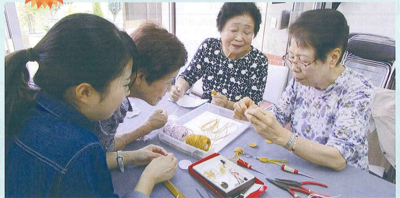
陽だまり(居場所づくり)