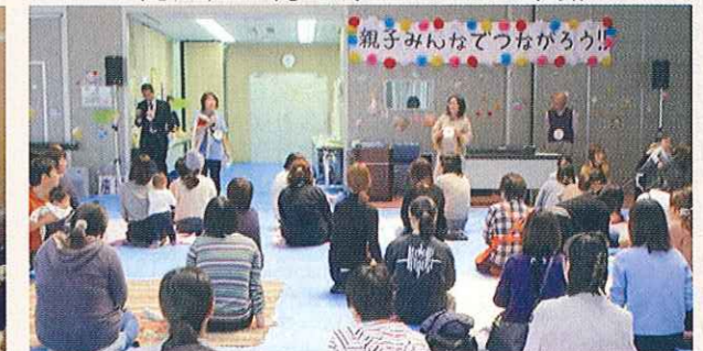
親子みんなであそぼう