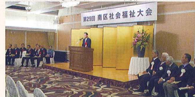
南区社会福祉大会