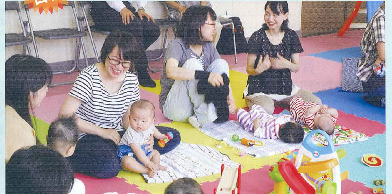
子育てサロン Good Time