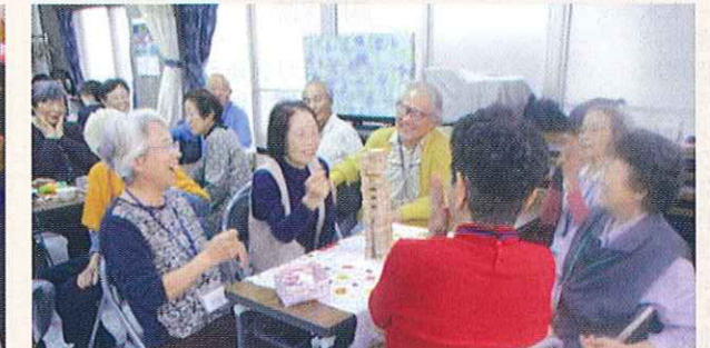
認知症の方が集うサロンの開催