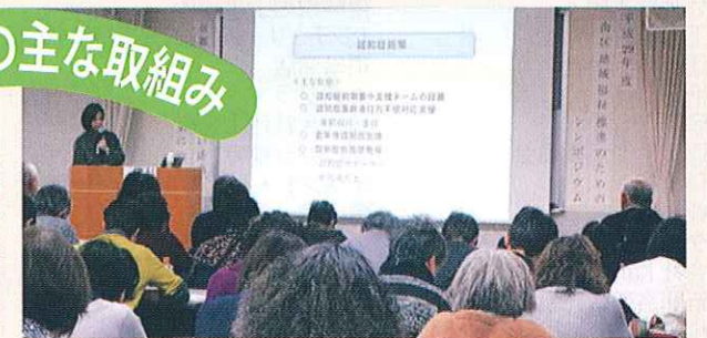
こころの健康を考える会発表会・講演会