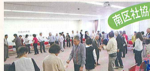
学区社協活動交流会