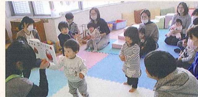
子育てサロンの開催