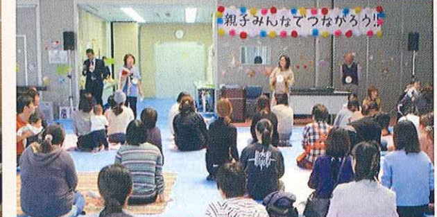
親子みんなであそぼう