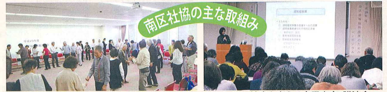
学区社協活動交流会

南区社会福祉協議会では、「地域の福祉力(=自覚、責任、協同)で実現する信頼の絆で結ばれた共生社会」を基本理念に、「ふれあい・見守り・支え合い活動」の充実発展に努めています。