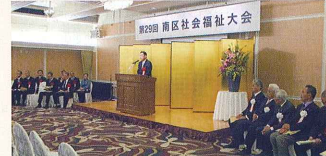
南区社会福祉大会