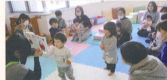
子育てサロンの開催