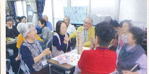
認知症の方が集うサロンの開催