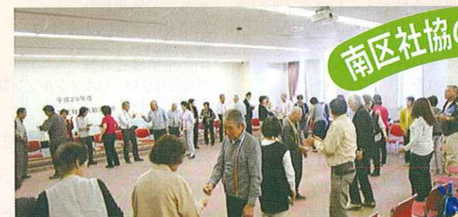
学区社協活動交流会

南区社会福祉協議会では、「地域の福祉力(=自覚、責任、協同)で実現する信頼の絆で結ばれた共生社会」を基本理念に、「ふれあい・見守り・支え合い活動」の充実発展に努めていきます。