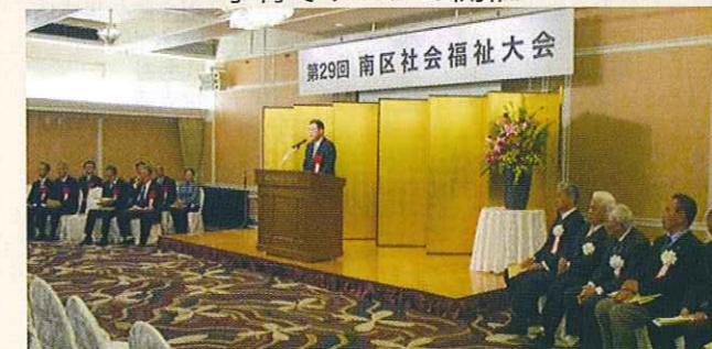
南区社会福祉大会