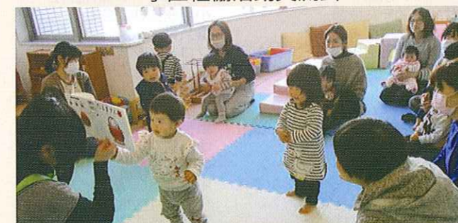
子育てサロンの開催