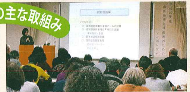
こころの健康を考える会発表会・講演会