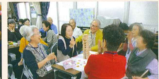
認知症の方が集うサロンの開催