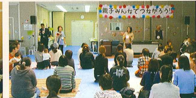
親子みんなであつなろう