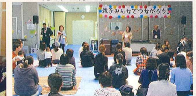
親子みんなでつながろう