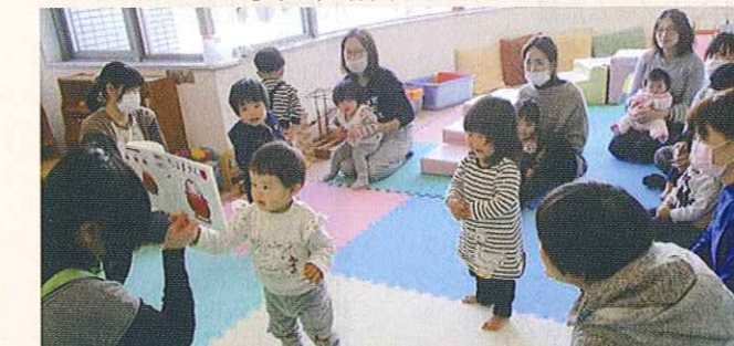
子育てサロンの開催