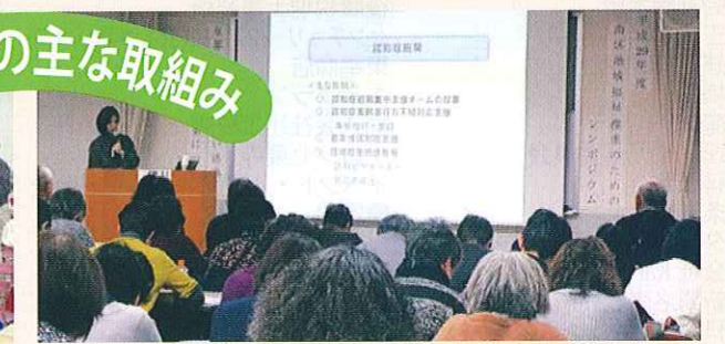
こころの健康を考える会発表会・講演会