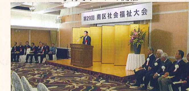
南区社会福祉大会