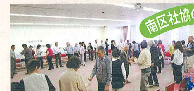
学区協活動交流会

南区社会福祉協議会では、「地域の福祉力(=自覚、責任、協同)で実現する信頼の絆で結ばれた共生社会」を基本理念に、「ふれあい・見守り・支え合い活動」の充実発展に努めています。