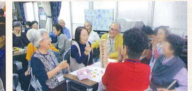
認知症の方が集うサロンの開催