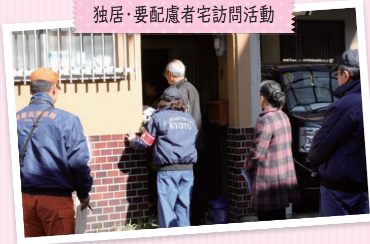
独居・要配慮者宅訪問活動