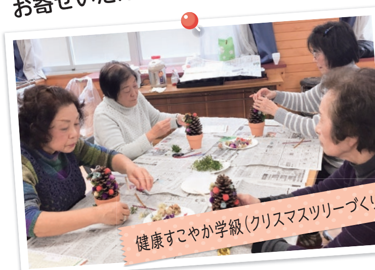
健康すこやか学級(クリスマスツリーづくり)