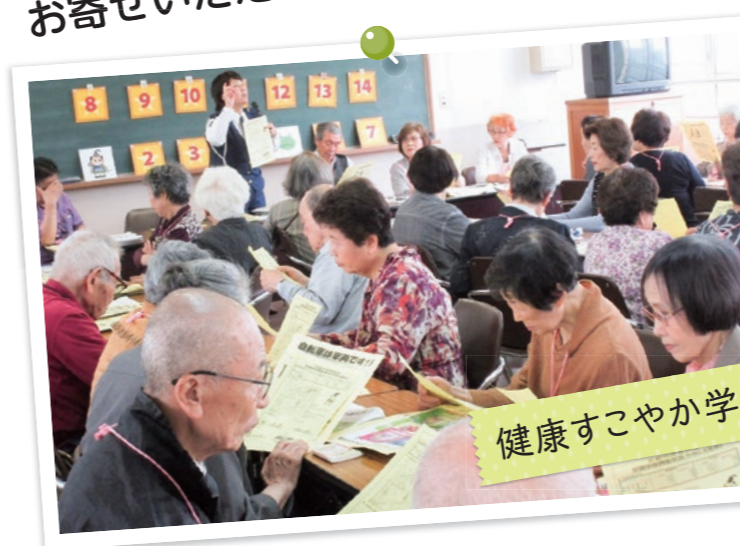
健康すこやか学級