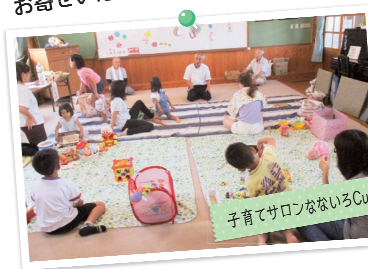
子育てサロンなないろCute