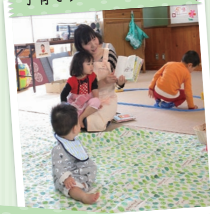
子育てサロンなないろCute(クリスマス会)