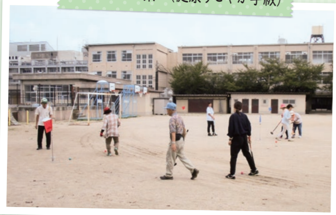
塔南シニアの集い(健康すこやか学級)