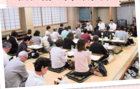
福祉協力員研修会