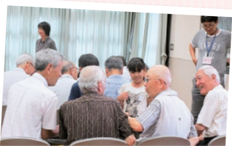
お年寄り子どもたちとのふれあい給食会