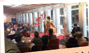
独居高齢者秋期昼食会

賛助会費合計額の6割を超える額(基本助成の50%と活動助成)が学区の活動財源となっています。