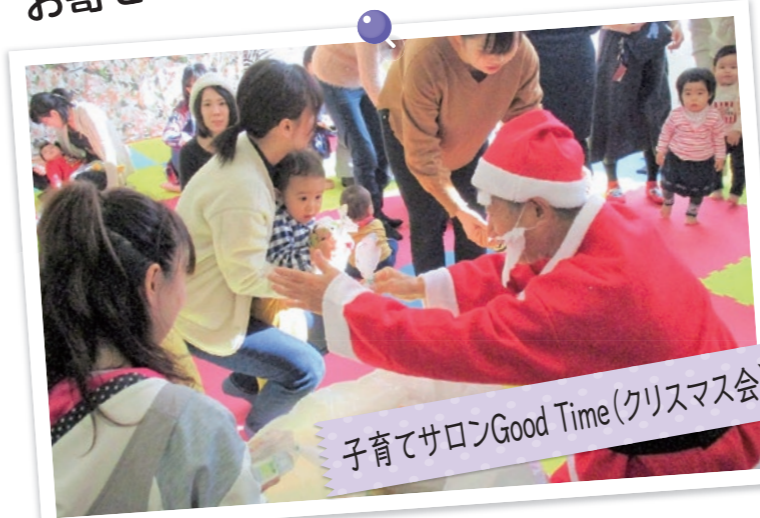
子育てサロンGood Time(クリスマス会)

重点目標 要配慮者の安全を図るため、地域ぐるみの要配慮者支援ネットワークの構築推進を目指す