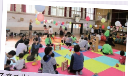
子育てサロンイベント~Good Time~ みんなあつまれ!いっぱい遊ぼう!