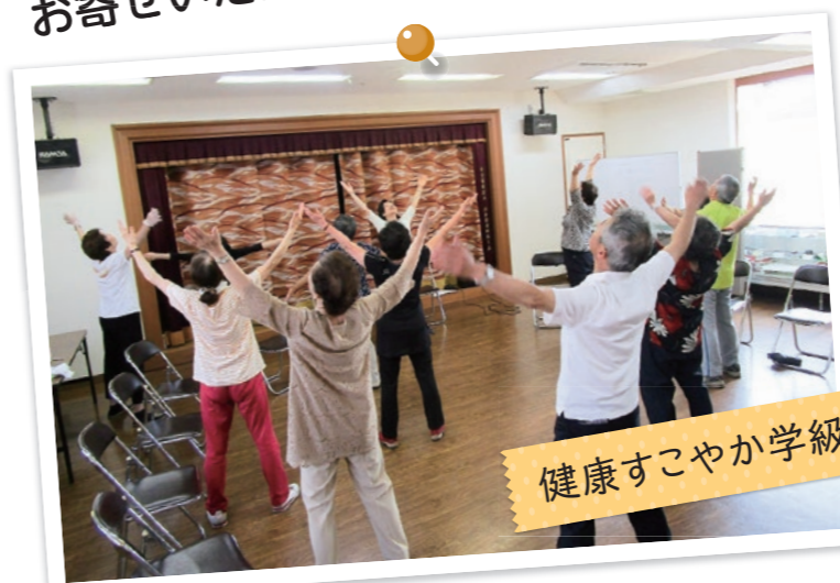
健康すこやか学級

重点目標 多くの方が気軽に参加できる健康すこやか学級や居場所の取り組みを進めます