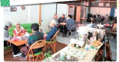
南区全体ですすめる地域福祉活動の一例