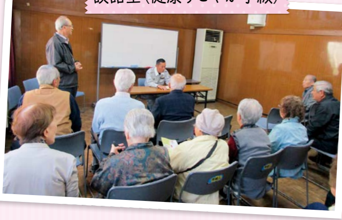
談話室(健康すこやか学級)