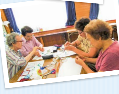
健康すこやか学級