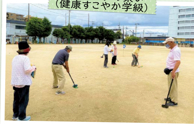
塔南シニアの集い (健康すこやか学級)