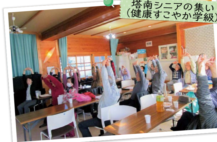
塔南シニアの集い (健康すこやか学級)