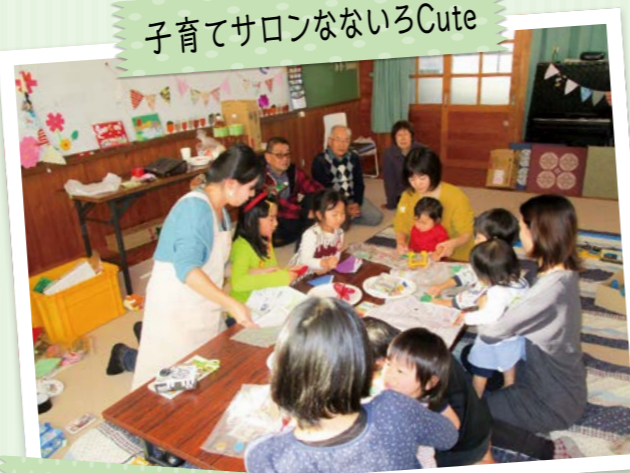
塔南シニアの集い・子育てサロンなないろCute合同クリスマス会