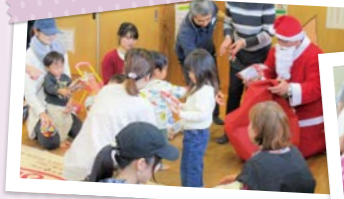
子育てサロン(クリスマス会)