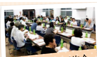
福祉協力委員研修会