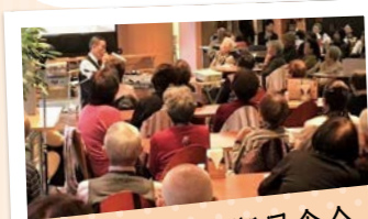
独居高齢者秋期昼食会