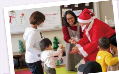
子育てサロン(クリスマス会)