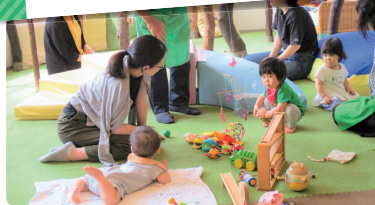
南区全体ですすめる地域福祉活動の一例