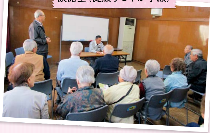
談話室(健康すこやか学級)