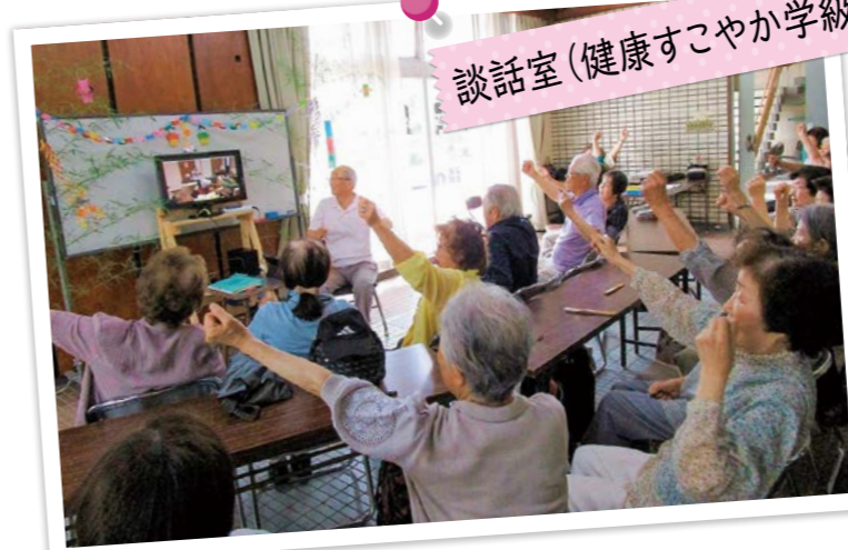
談話室(健康すこやか学級)