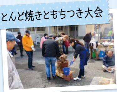
とんど焼きともちつき大会