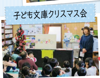
子ども文庫クリスマス会