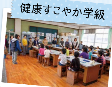
健康すこやか学級