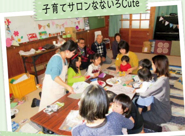
塔南シニアの集い・子育てサロンなないろCute合同クリスマス会