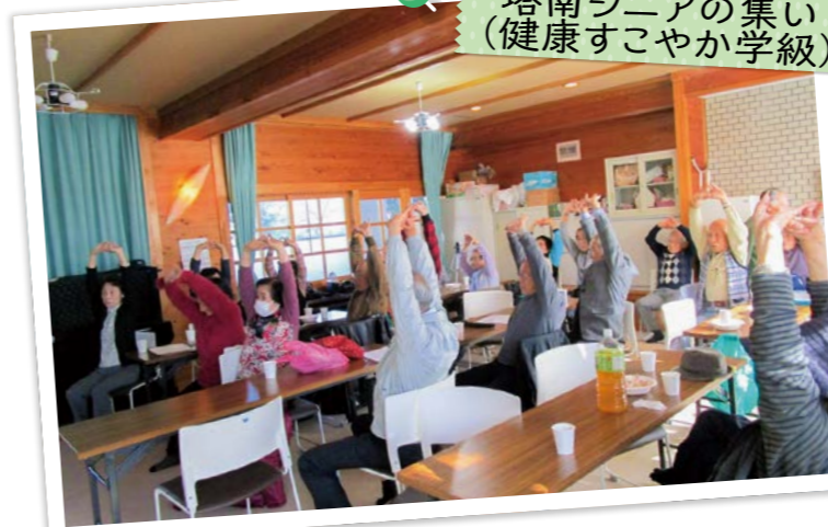
塔南シニアの集い (健康すこやか学級)