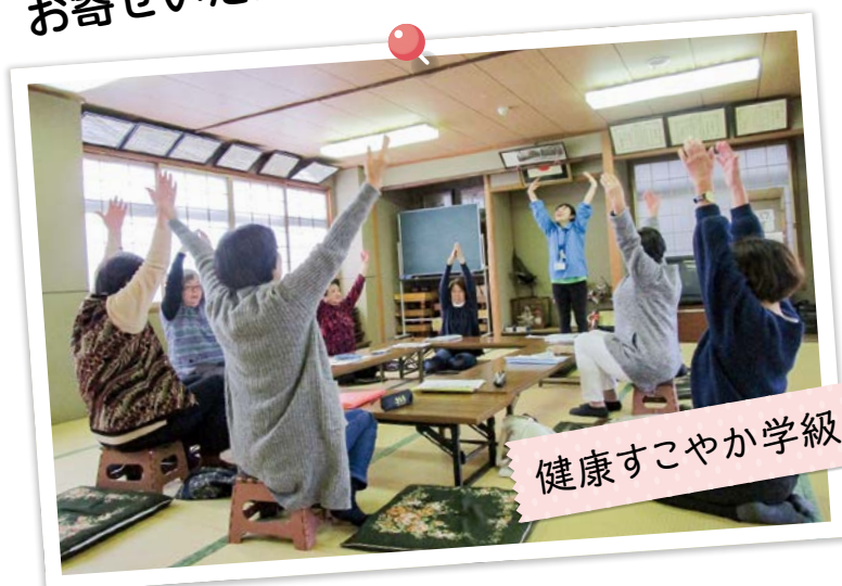
健康すこやか学級

重点目標 子どもから高齢者まで見守る人がいて、居場所や活躍の場がある地域を目指します