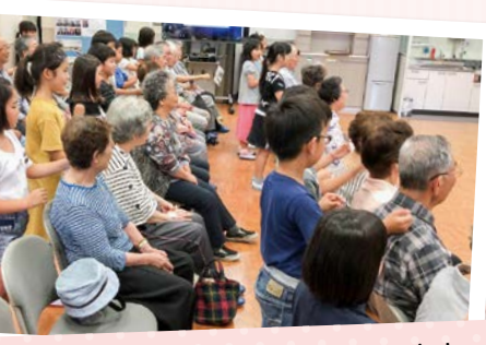
お年寄りと子どもたちのふれあい給食会