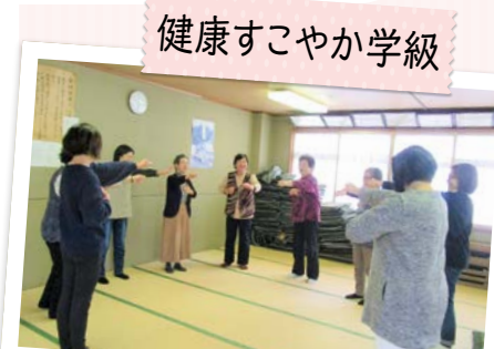
健康すこやか学級