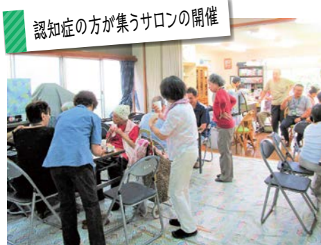
認知症の方が集うサロンの開催