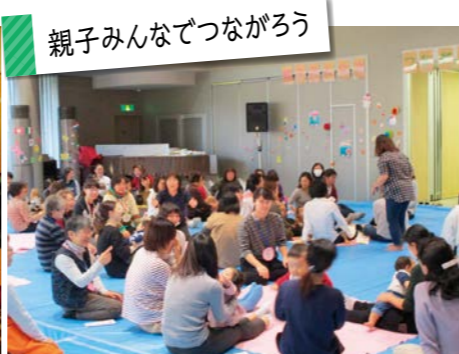
親子みんなであつなろう