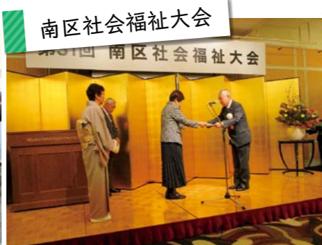
南区社会福祉大会