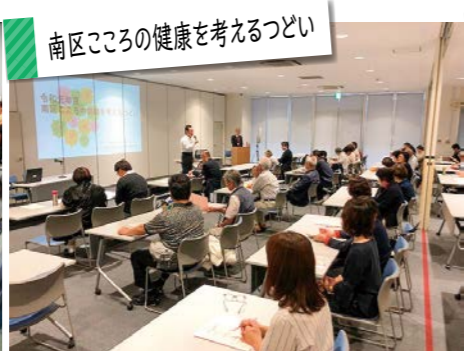
南区こころの健康を考えるつどい