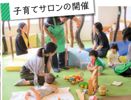
子育てサロンの開催