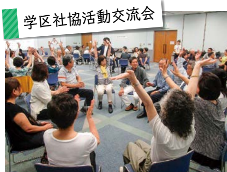
学区社協活動交流会