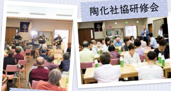
レクリエーション