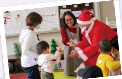
子育てサロン(クリスマス会)