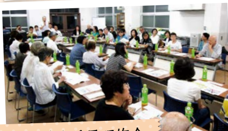
福祉協力委員研修会