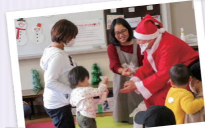
子育てサロン(クリスマス会)