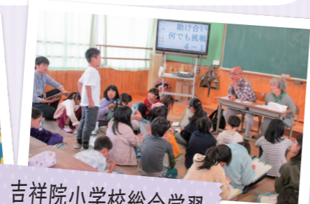
吉祥院小学校総合学習