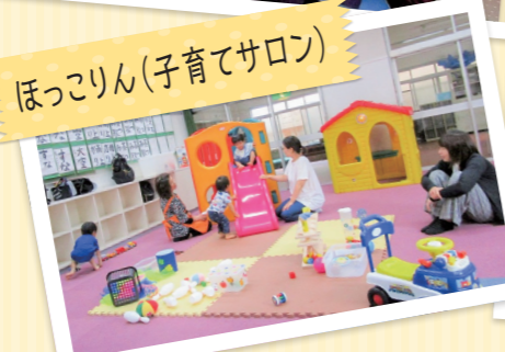
ほっこりん(子育てサロン)