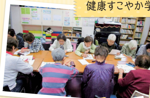
健康すこやか学級