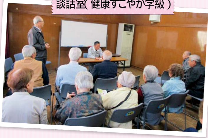
談話室(健康すこやか学級)