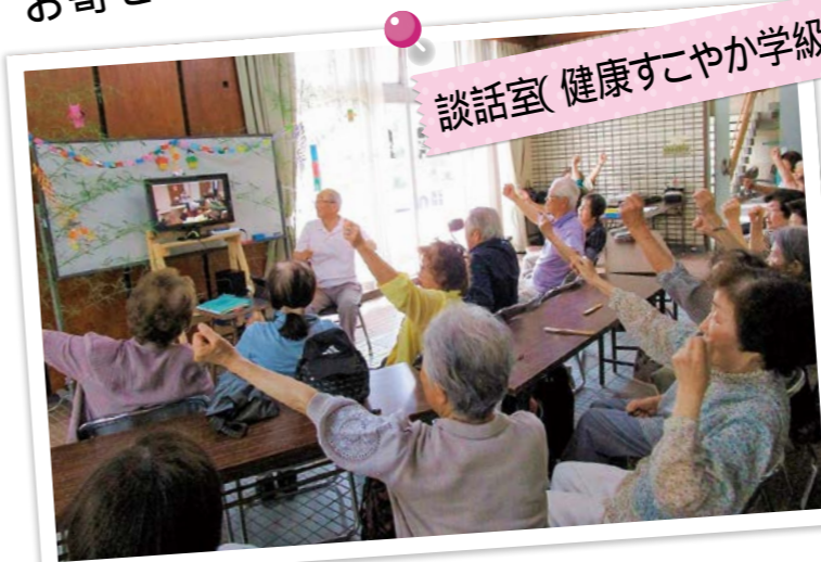
談話室(健康すこやか学級)