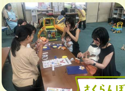
さくらんぼ(子育てサロン)