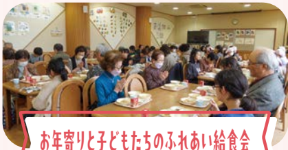
お年寄り子どもたちのふれあい給食会