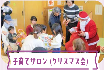
子育てサロン(クリスマス会)