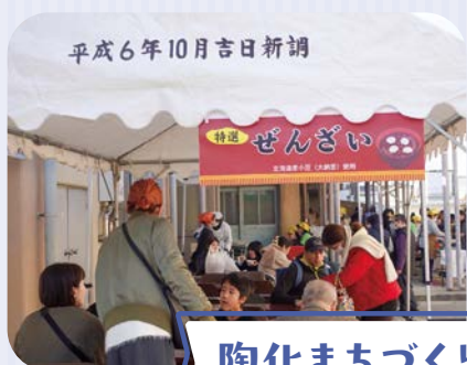
陶化まちづくりもちつきフェスタ