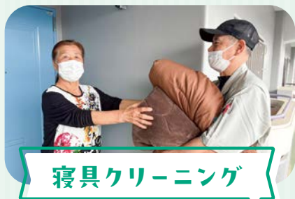
寝具クリーニング