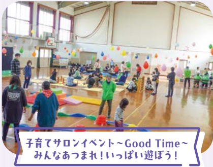
子育てサロンイベント～Good Time～ みんなあつまれ！いっぱい遊ぼう！