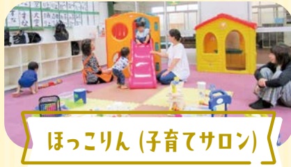
ほっこりん(子育てサロン)