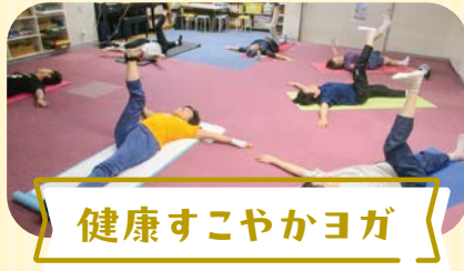
健康すこやかヨガ