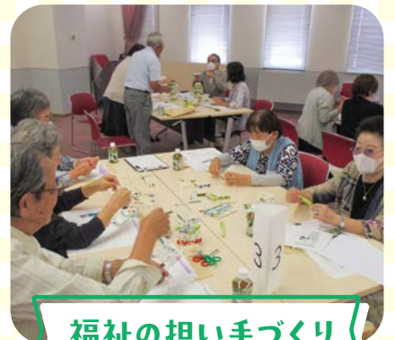
福祉の担い手づくり